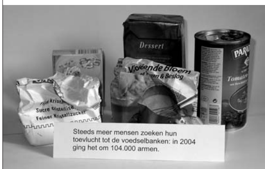
Steeds meer mensen zoeken hun toevlucht tot de voedselbanken: in 2004 ging het om 104.000 armen. Blik - voedsel: bloem, pasta