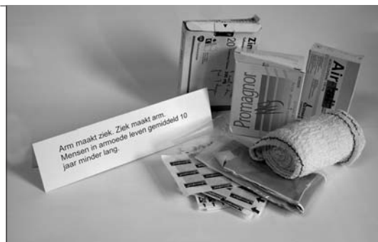
Arm maakt ziek. Ziek maakt arm. Mensen in armoede leven gemiddeld 10 jaar minder lang. veel medicijnen