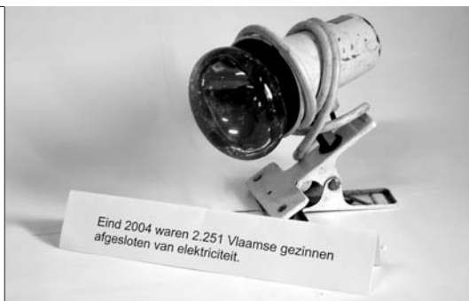
Eind 2004 waren 2.251 Vlaamse gezinnen afgesloten van elektriciteit. kleine elektrische toestellen, kaarsen