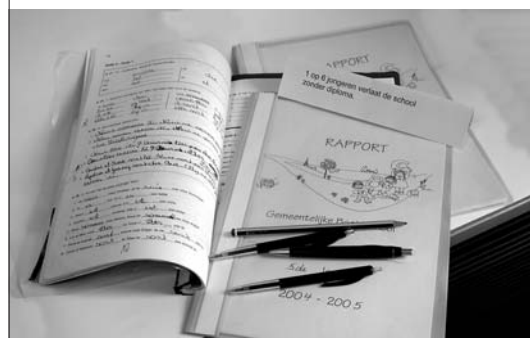
1 op 8 jongeren verlaat de school zonder diploma. iets over school: boeken, pennenzak