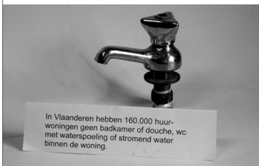
In Vlaanderen hebben 160.000 huurwoningen geen badkamer of douche, wc met waterspoeling of stromend water binnen de woning. bakstenen/pannen